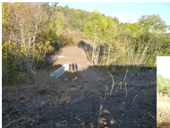
Piste d'accès à l'ouvrage d'art : franchissement du ruisseau.