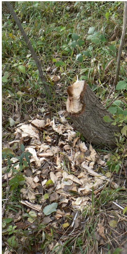
Indice de présence du castor

L'animation de ce site Natura 2000 est portée par le Syndicat Mixte de Gestion Intercommunautaire du Buëch et des ses Affluents (SMIGIBA) qui a également en charge la mise en oeuvre du contrat de rivière "Buëch vivant Buëch à vivre".